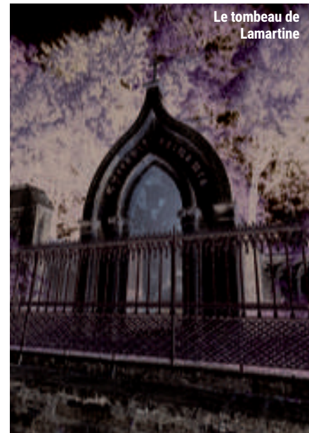
Le tombeau de Lamartine