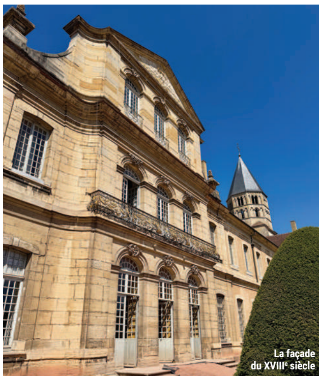
La façade du XVIII e siècle