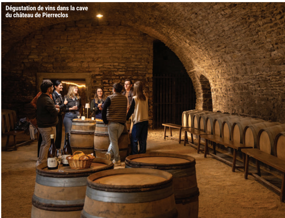
Dégustation de vins dans la cave du château de Pierreclos