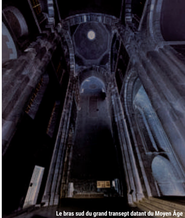
Le bras sud du grand transept datant du Moyen Âge