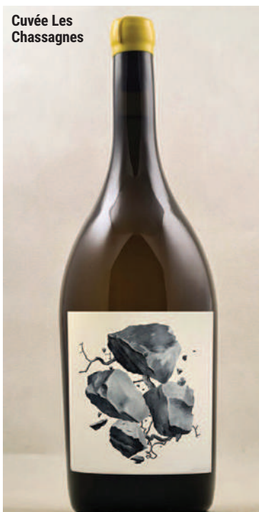
Cuvée Les Chassagnes