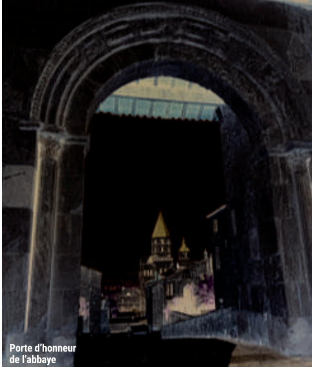
Porte d'honneur de l'abbaye