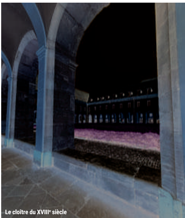
Le cloître du XVIII e siècle