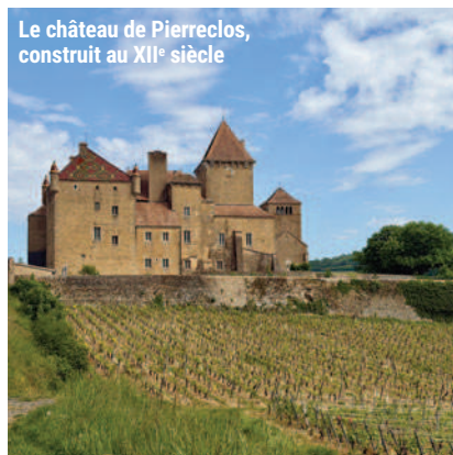
Le château de Pierreclos, construit au XII e siècle