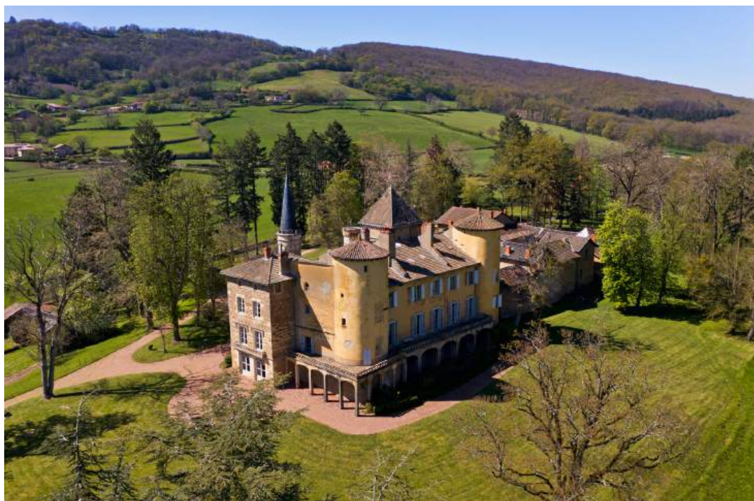
Façade sud-est du château de Saint-Point

Alphonse de Lamartine hérita du château en 1820, année de son mariage avec Mary Ann Birch, aristocrate et artiste anglaise, qui deviendra Marianne de Lamartine. Cette même année, parurent les Méditations poétiques , faisant de lui le père du romantisme et un auteur reconnu et admiré par toute une génération, de Victor Hugo à Sainte-Beuve. Grâce au succès de ce recueil de poésie, Lamartine transforma le vieux château médiéval hostile, saccagé pendant la Révolution française, en manoir néogothique à l'anglaise. Marianne conçut une partie des décors et ils ajoutèrent tour, tourelle, portique et balcon au château, marquant à jamais ce lieu de leur goût. Ils créèrent également le parc à l'anglaise du château, un des premiers parcs romantiques de Saône et Loire.