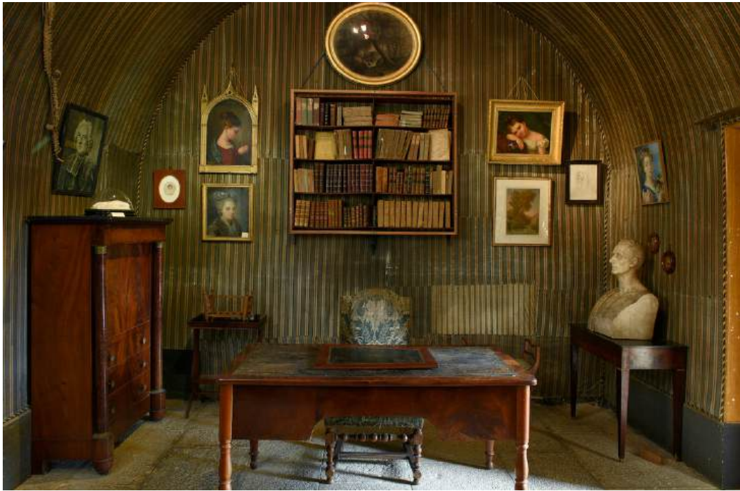
Cabinet de travail de Lamartine - château de Saint-Point

A Saint-Point, Marianne et Alphonse de Lamartine reçurent leurs proches et amis dont certains des plus grands écrivains et artistes romantiques de leur temps tels Victor Hugo, George Sand, Eugène Sue, Frédéric Chopin ou encore Franz Liszt, qui mit en musique les Harmonies poétiques et religieuses de Lamartine.