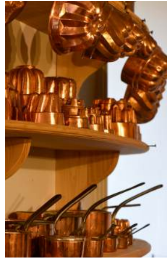
Moules et casseroles en cuivre du XIXe siècle

Parmi les collections du château figurent de nombreuses oeuvres de Marianne de Lamartine, artiste formée par le peintre romantique Henri Decaisnes, proche des Lamartine.