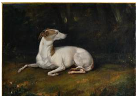
Portrait de Fido, le chien préféré du poète par Marianne de Lamartine