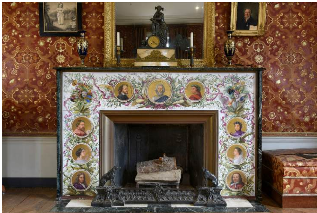
Cheminée des poètes peinte par Marianne de Lamartine - chambre d'Alphonse de Lamartine

Comme d'autres maisons d'artiste (Hauteville House pour Victor Hugo, la Villa Arnaga pour Edmond Rostand, la maison de Rochefort pour Pierre Loti, le Château de Bye pour Rosa Bonheur...), le château de Saint-Point peut se concevoir comme une œuvre d'art totale, façonnée par le goût romantique d'Alphonse de Lamartine.