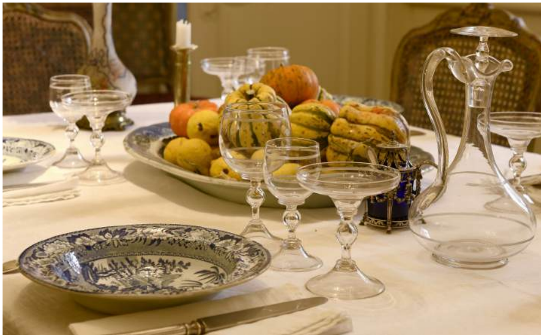
Salle-manger du château de Saint-Point - Service en faïence anglais et verres en cristal gravés du chiffre AL