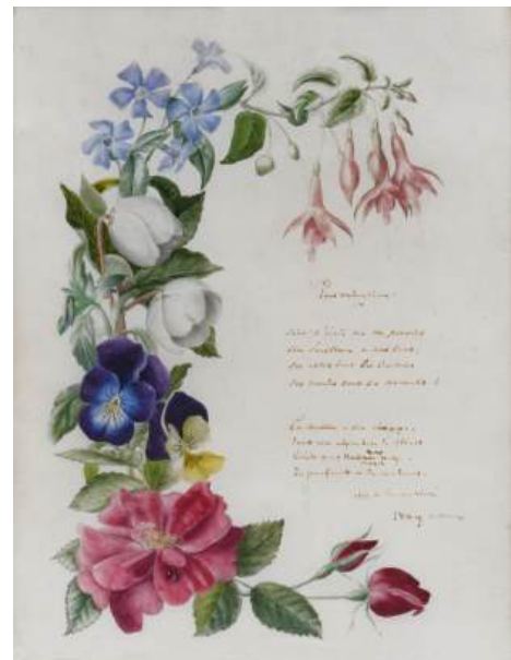
Enluminure par Marianne de Lamartine d'un poème de son mari, intitulé "Pour Valentine", dédiée à sa nièce, Valentine de Cessiat, qui hérita de Saint-Point à la mort de Lamartine et en fit dès 1869 un lieu de mémoire.