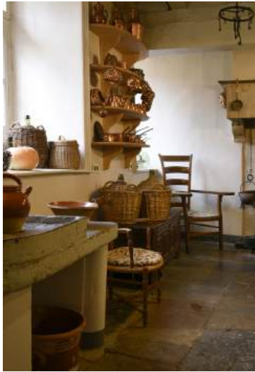
Cuisine historique du château