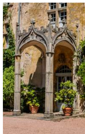
Portique néogothique du château