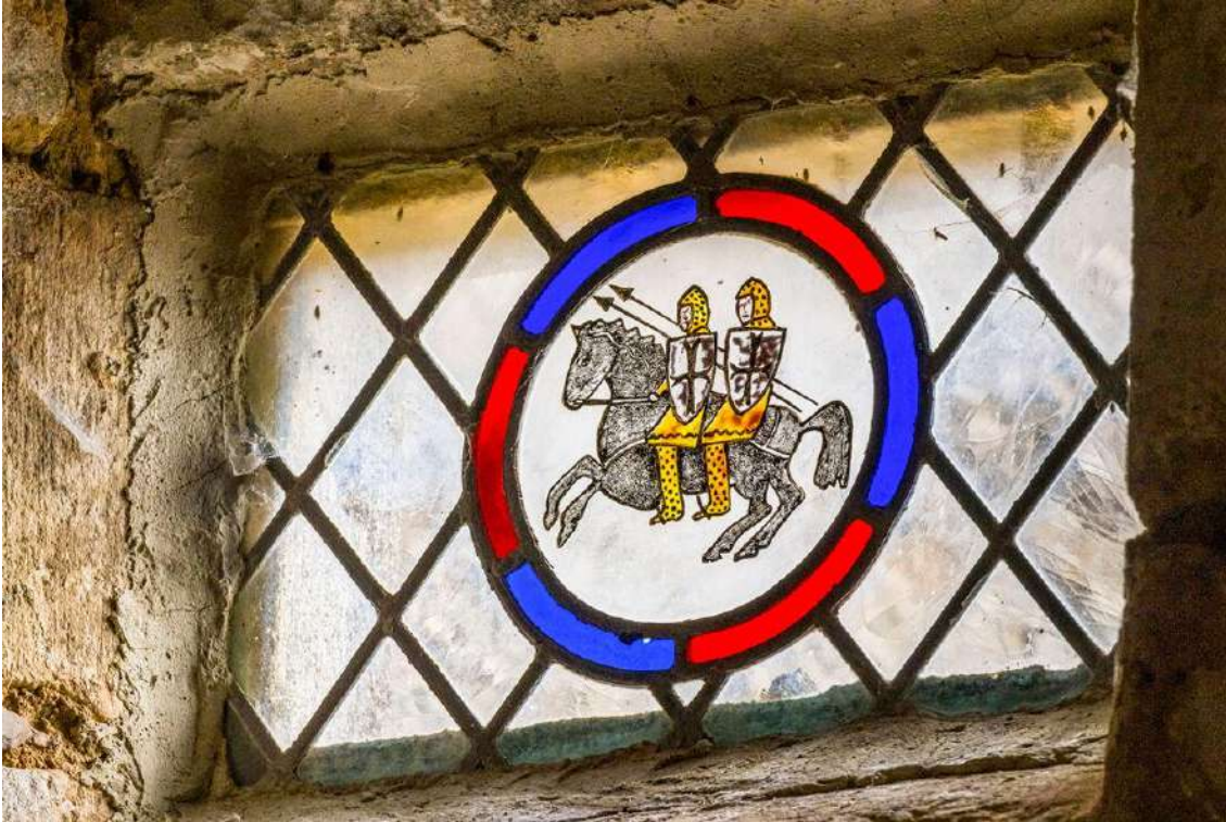
La Commanderie de La Couvertoirade, dans l'Aveyron.