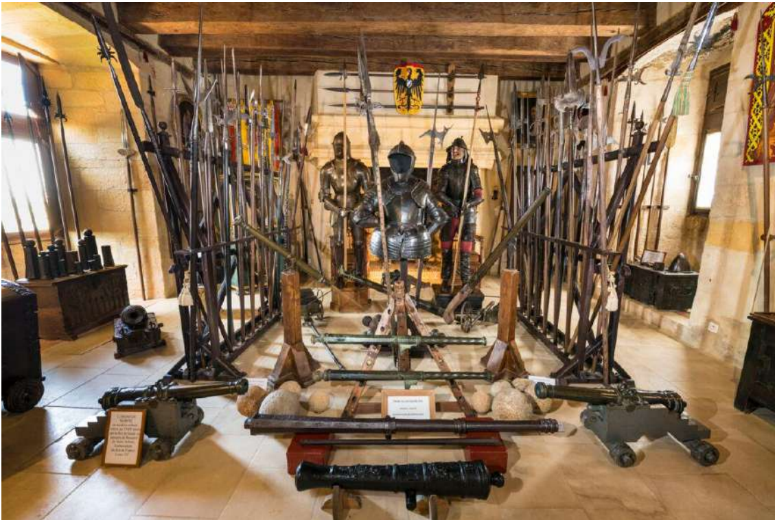
Le Château de Fénelon, en Dordogne.

laquelle il devient anglais avant que les troupes du duc d'Anjou ne le reprennent, en 1375. Théâtre de terribles batailles pendant les guerres de Religion, ce bastion du catholicisme verra naître l'écrivain-théologien précurseur des Lumières Fénelon en 1651. En ruines et à l'abandon, il a été sauvé par une famille de passionnés dans les années 1990.