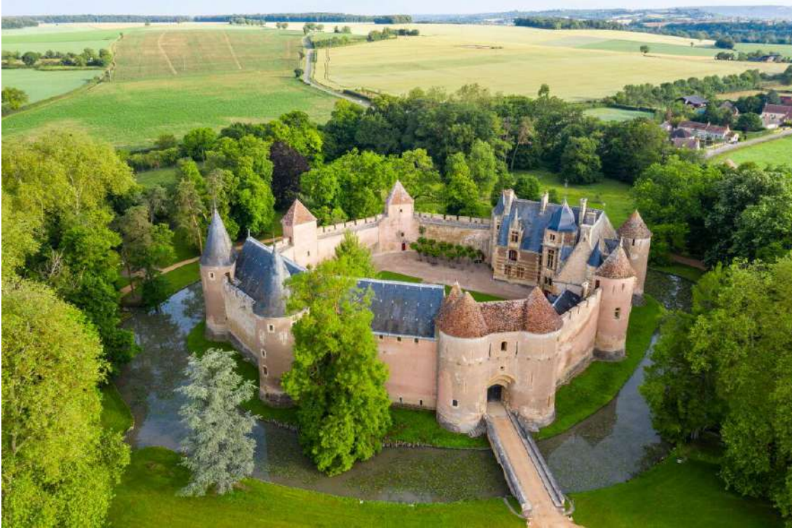
Le Château d'Ainay-le-Vieil, dans le Cher.