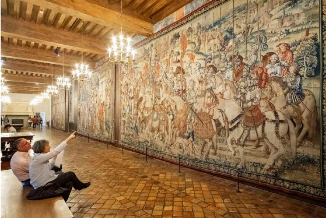
Le Château d'Écouen, dans le Val-d'Oise.